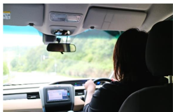
スーパーや病院等への無料送迎