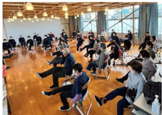
足腰の筋力トレーニング