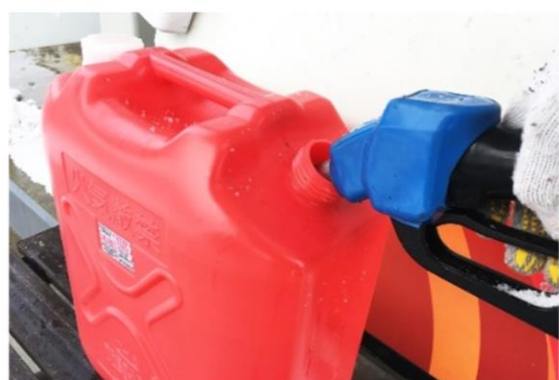
灯油や電球交換等の生活おたすけサービス