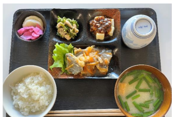
管理栄養士監修の昼食